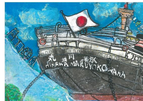
2025 年 第 42 回ファミリー写生大会 市長賞 受賞作品